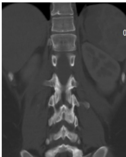
Figura 2. Infarto esplénico

comienza a presentar febrícula 38°C y dolor lumbar izquierdo de moderada a fuerte intensidad. Al examen físico se evidencia signos vitales dentro de la normalidad; tórax sin alteraciones; abdomen blando, doloroso en hipocondrio izquierdo sin irritación peritoneal ni megalias. Laboratorio sin alteraciones (cuanta blanca normal). Se realizó ecosonograma y nueva TC de abdomen con los hallazgos de absceso esplénico en polo superior y barro biliar (Figura 3). Se intenta tratamiento médico con antibioticoterapia endovenosa (mismo esquema) sin respuesta a las 72 horas, por lo que se decidió intervención quirúrgica: esplenectomía y colecistectomía por laparoscopia, previa administración de profilaxis para gérmenes encapsulados (vacuna antineumocócica polisacáridica y anti haemophilus influenzae tipo B).