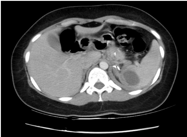
Figura 3. Absceso esplénico en el polo superior